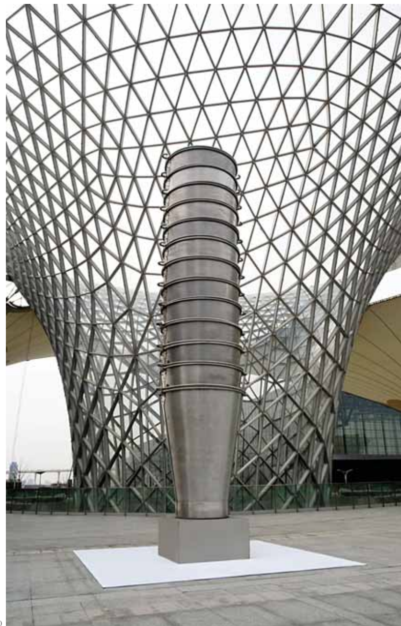
苏泊德·古普塔 《信念的飞跃》 2006 不锈钢 700 × 180 × 180 (厘米)