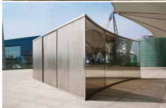
丹·格雷厄姆 《E.S. 曲线》 2005 双向玻璃镜、不锈钢材质 600 × 600 × 220 (厘米)