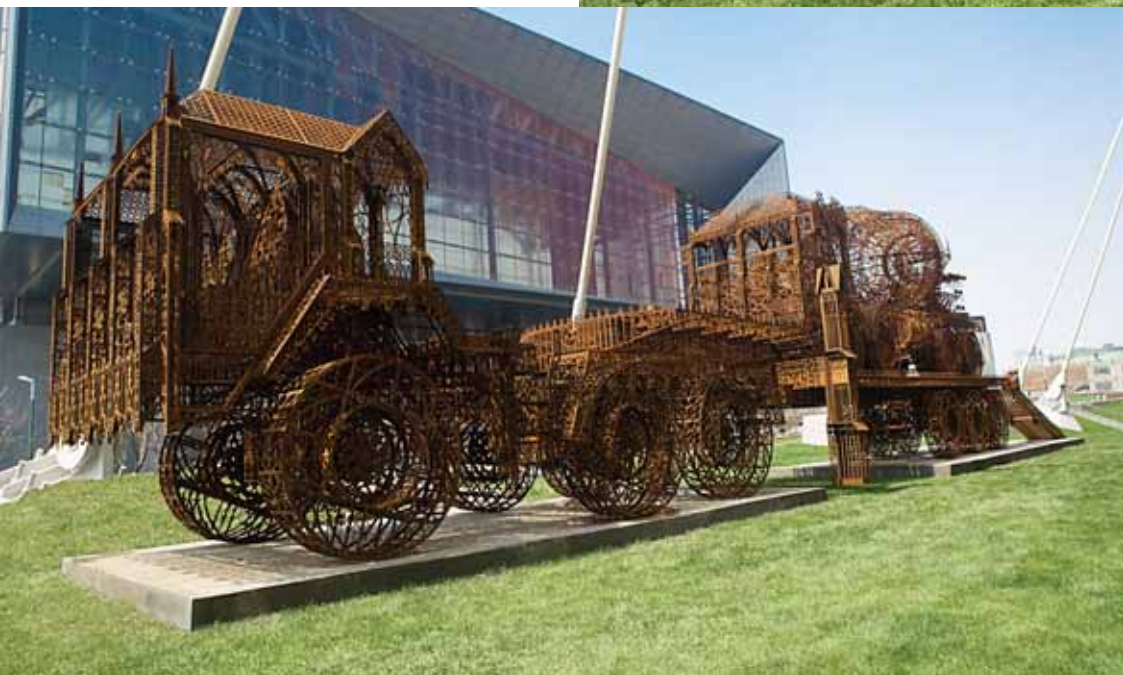
威姆·德沃伊 《平板拖车》 2007 激光切耐候钢 不规则尺寸